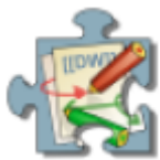
Diagram для «ДокуВики»

Построение схем и генеалогических деревьев, состоящих из блоков и линий соединения. Плагин расширяет синтаксис «Докувики» и позволяет строить диаграммы.